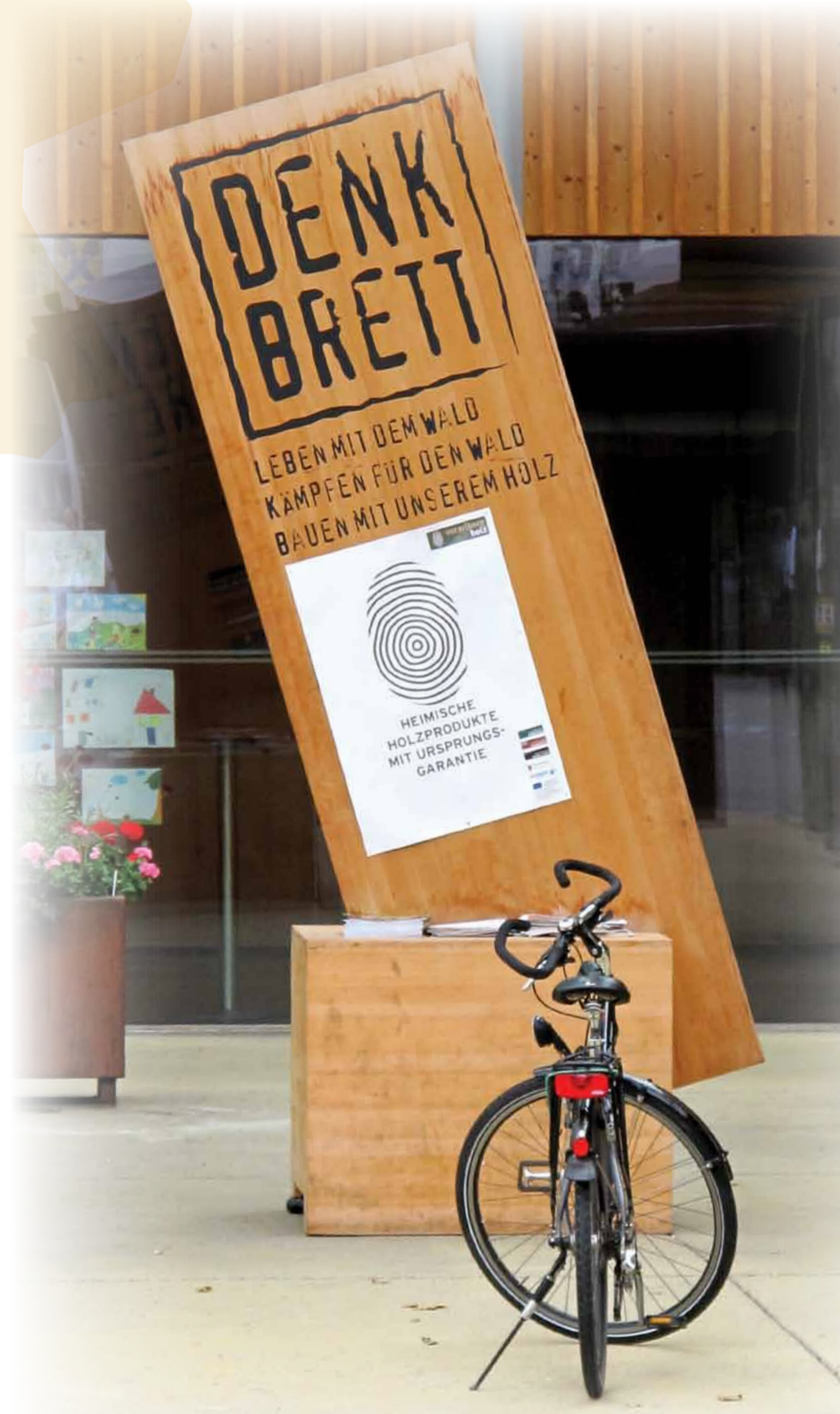
Exemple de campagne de promotion du bois : «DENK BRETT»: «PENSEZ PLANCHE»