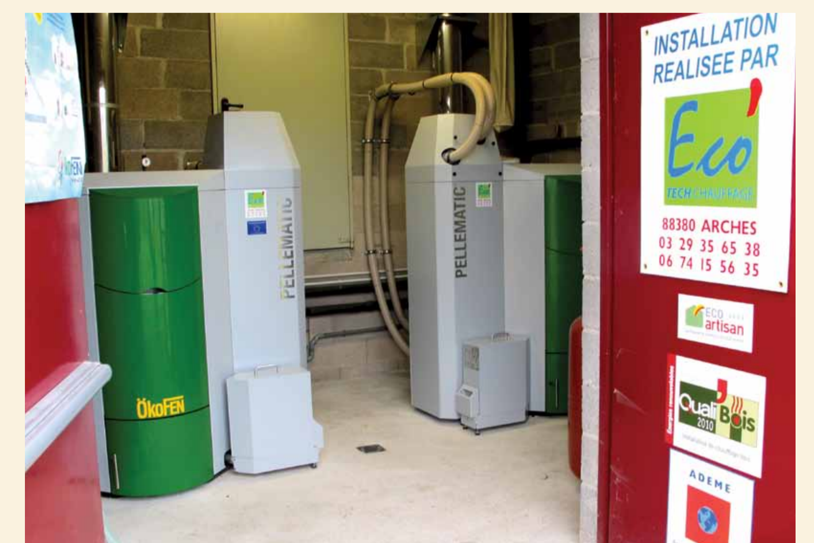
Une 1e dans les Vosges, la chaudière d'appoint est également alimentée par du granulé de bois.

Le Palmarès Climat est une des actions financées dans le cadre du Plan Climat - Energie Territorial du Syndicat Mixte du SCoT des Vosges Centrales. Son cofinancement est assuré par le partenariat suivant.