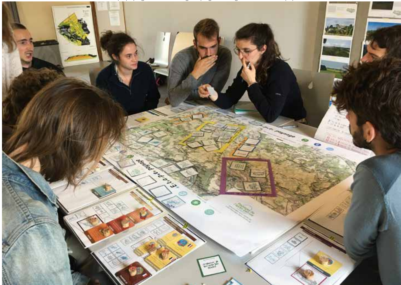
Etape paysage en séminaire AgroPaysage à la Bergerie de Villarceaux (95)

méthaniseurs plutôt que des éoliennes (ou l'inverse), etc.